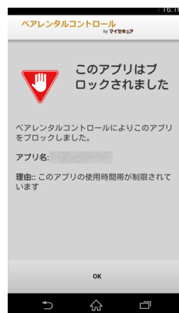
アプリケーション コントロール機能