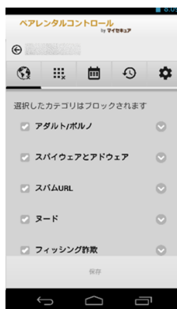
URLフィルタリング機能