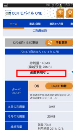
「OCN モバイル ONE アプリ」

また、実際に繰り越したデータ容量は、「OCN モバイル ONE アプリ」やOCNマイページで確認できます。