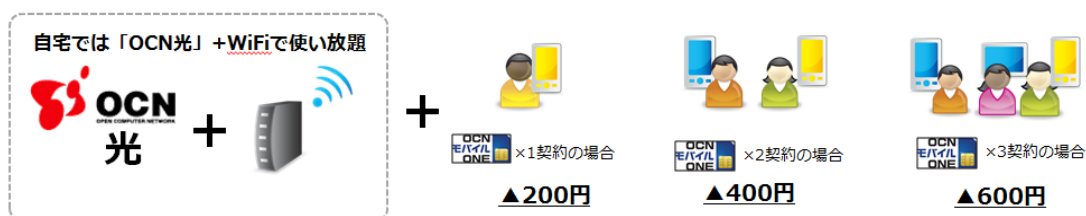
(図 1) 「OCN 光モバイル割」適用イメージ