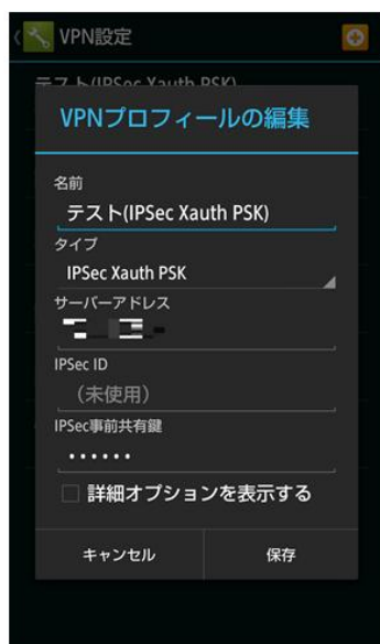
IPsec Xauth PSK