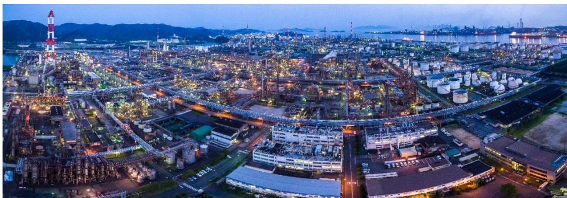
図 2. 三菱ケミカル 岡山事業所