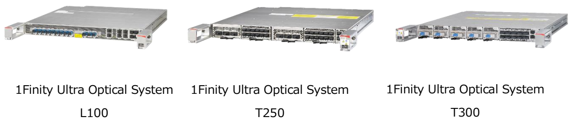
図 4. APN 装置