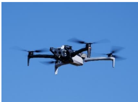
<活用機体 : Skydio X10 ※9 >