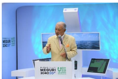
日本財団 笹川会長

当該プログラムは、2020年からスタートした MEGURI2040 の第2ステージとして位置づけられ、第1ステージとして実施された「無人運航船の実証実験にかかる技術開発共同プログラム」で培った無人運航船技術の2025年の本格的な実用化を、日本財団と共に目指します。