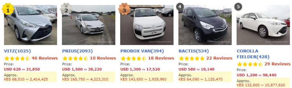
「自国通貨表示」イメージ