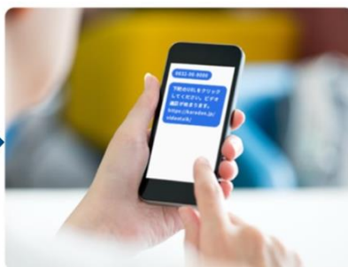
②患者はスマートフォンなどで、SMSに届いたURLをクリック