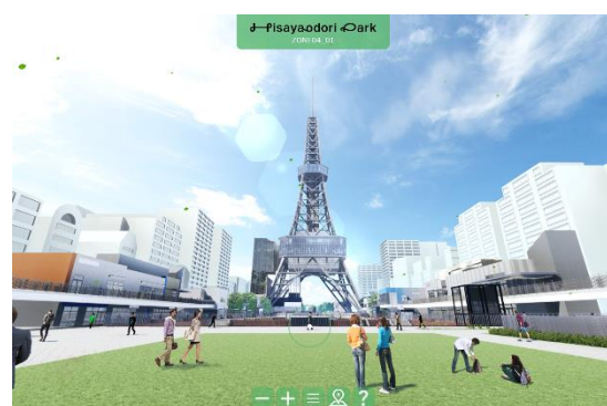
Hisaya Digital Park