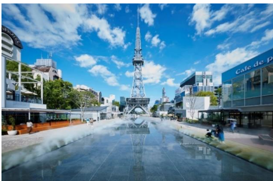
Hisaya-odori Park 外観