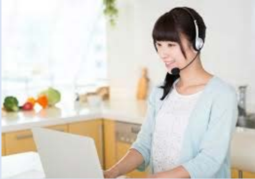
在宅型コンタクトセンター