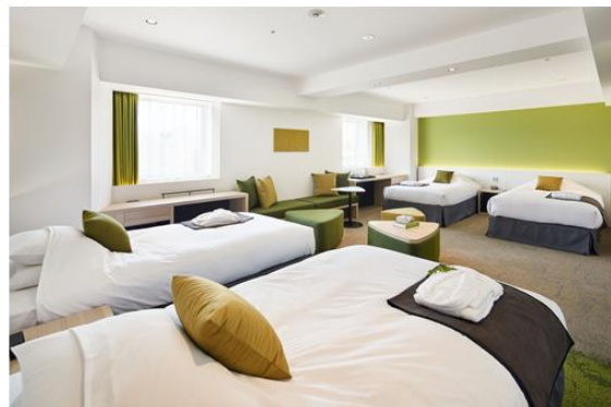
ホテルレオパレス札幌 客室