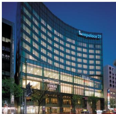
ホテルレオパレス博多 外観