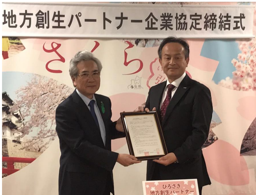
（左：弘前市 葛西 憲之 市長、右：NTT Com取締役 菅原 英宗）

本協定締結は、タブレット端末などのICTを活用した授業づくりや、児童生徒一人ひとりに最適な教育システムの構築など、「弘前市まち・ひと・しごと創生総合戦略」における教育施策の実現を目的にしています。