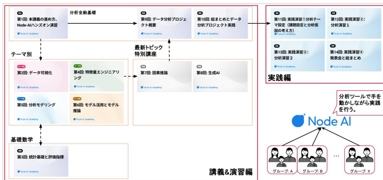
<カリキュラム構成マップ>