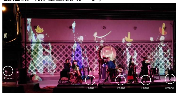
配信側（齋理屋敷ステージ）

本実証は、宮城県伊具郡丸森町の「蔵の郷土館 齋理屋敷」で実施しました。複数台の iPhone で、奥州・仙台おもてなし集団「伊達武将隊」の演武や、パフォーマンス集団「白 A」の演出、宮城県丸森町太鼓集団の「旅太鼓」のパフォーマンスを撮影。撮影した映像は、遠隔にいる参加者が自身の PC などから好みの視点で見られるようにしました。映像生成、配信システムは、マルチアングル映像が体験できる SwipeVideo を利用し、ステージから配信システムへの音声映像送信に 5G を使用しました。