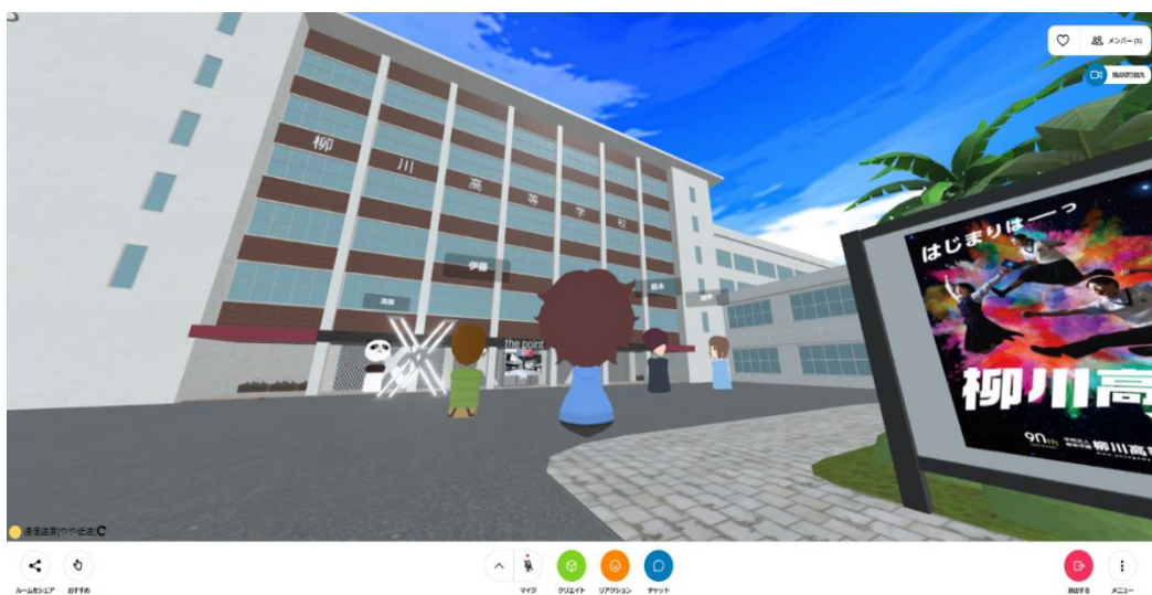
図 1 ①柳川高校校舎空間