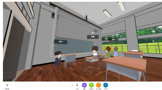
図 3 ③日本の教室空間