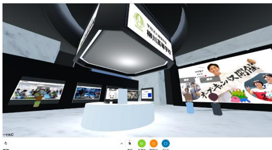
図 2 ②学校紹介空間