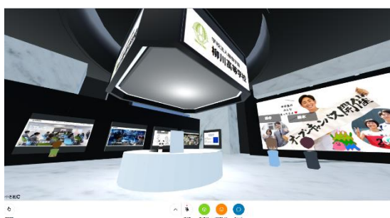
図 2 ②学校紹介空間