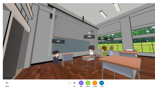
図 3 ③日本の教室空間