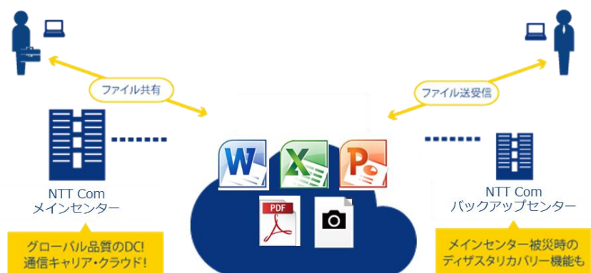
(図3) Biz ストレージ ファイルシェア