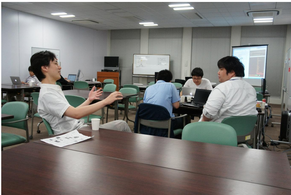
図 7：議論を交わすメンバーたち

2日目に入り着々と点数を伸ばします。グループウェアで進捗状況や情報などを共有しますが、そのほかにも実際にメンバー間で活発に議論が交わされ、アイデアなどが生まれ問題解決の糸口がみえることもあります。