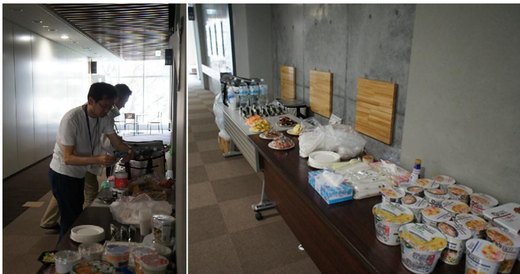
図 6 : 事務局も選手をサポート