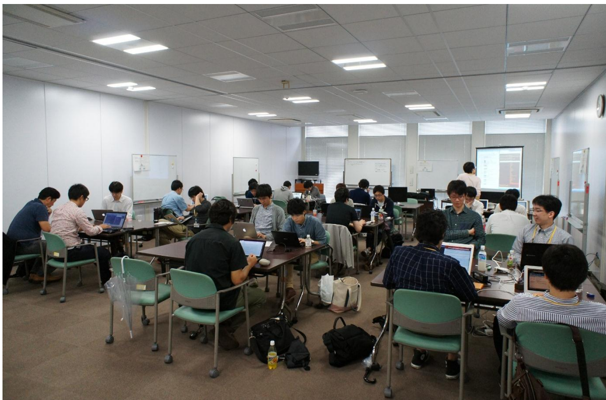
図 4：真剣な表情で取り組むメンバーたち

初日はあいにくの雨天でしたが、朝 8 時過ぎから続々とメンバーが集結し、午前中の時点で 36 名ものメンバーが集まりました。（事務局スタッフを含む）