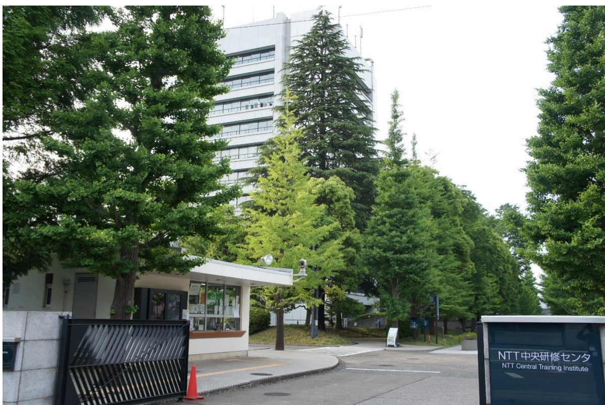
図2：会場となった NTT 中央研修センタ

会場は、集合するメンバーが収容でき、ネットワークや宿泊などの環境を確保できる施設である NTT 中央研修センタ（東京都調布市）としました