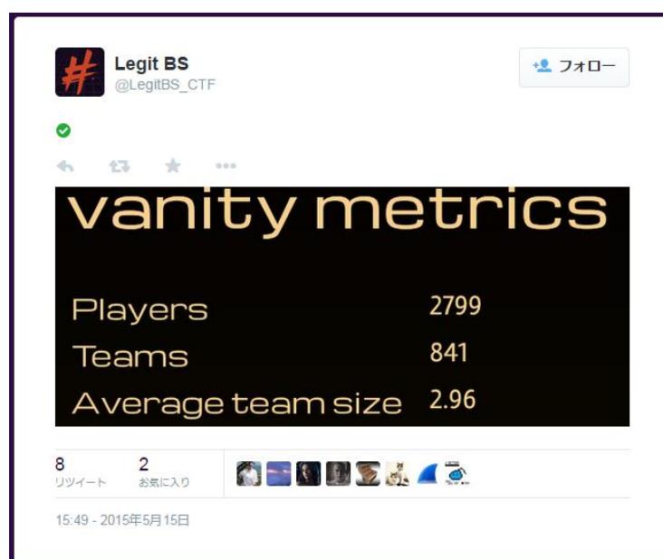
図1：DEF CON 公式 Twitter より

team enu は NTT コミュニケーションズ、NTT コムセキュリティ、NTT セキュアプラットフォームフォーム研究所等の有志メンバーおよび事務局スタッフで構成されたチームですが、今回はセキュリティエンジニアの育成、情報共有や交流の場をつくる目的として賛同していただいた6名の大学生メンバーも合流し、3日間合計52名の体制（事務局スタッフを含む）で48時間の戦いに挑みました。