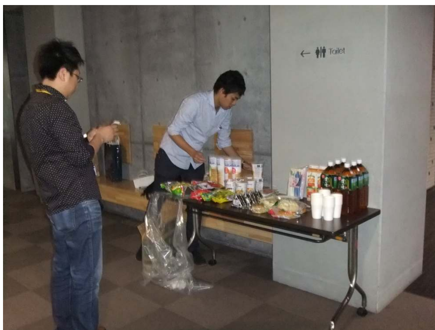
図 4 : 選手を陰ながらサポートする事務局