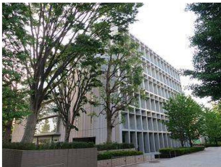
「team enu」が本拠地を置いた NTT 中央研修センタ

今年（2014年）のDEFCON CTFは、日本時間の5月17日午前9時から19日午前9時にかけて予選が開催されました。今回も「team enu」はNTTコムセキュリティを中核にNTTコミュニケーションズ、NTTセキュアプラットフォーム研究所等の有志および事務局を含めた総勢50名の布陣を組み、計48時間の戦いに挑みました。