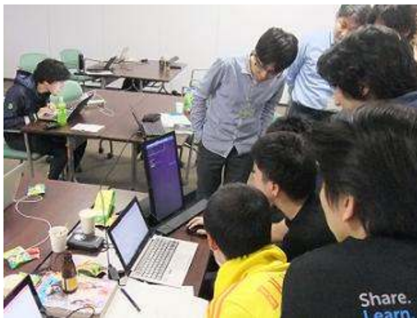
図 5 : 作戦会議模様 (その 3)