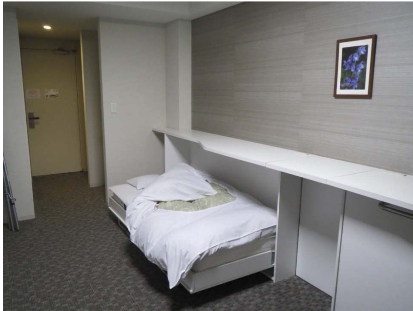
図 5 : NTT 中央研修センタ内宿泊施設（仮眠部屋）

「team enu」が解いた問題については、後日この Web サイト上にレポートとして解答を掲載する予定です。