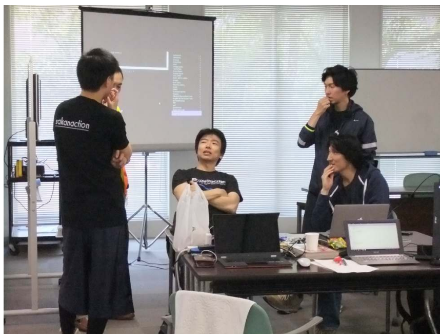
図 2：作戦会議模様（その 1）