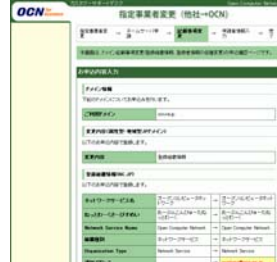
[記載事項変更確認画面]