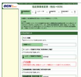
[指定事業者変更入力画面]