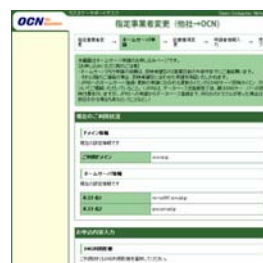
[ネームサーバ申請入力画面]