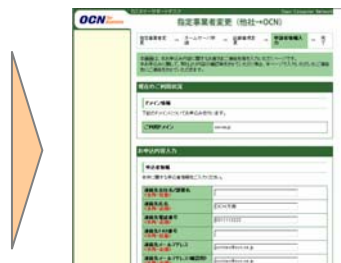
[お申込者情報入力画面]