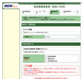
[記載事項変更入力画面]