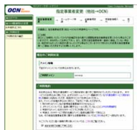
[指定事業者変更入力画面]