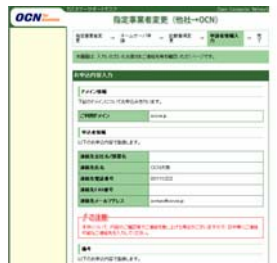
[お申込者情報確認画面]