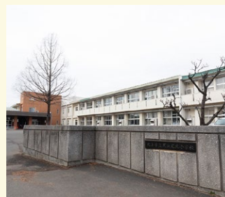
[取材協力] 北上市立黒沢尻北小学校

岩手県の美しい田園風景が広がる平野部に位置する北上市には、小学校が17校、中学校が9校あります。GIGAスクール構想に基づく環境整備では、全小中学校にLTEモデルのChromebookが導入されました。2021年度から各校で一人1台の端末の活用がはじまっています。